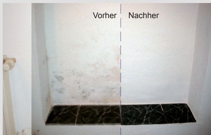
KefaRid beseitigt den Schimmel dauerhaft