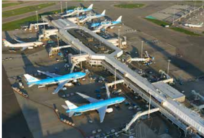
Die KÖSTER BAUCHEMIE AG ist ein weltweit führender Produzent von TPO- und ECB-Dachbahnen mit über 25 Jahren Erfahrung.

Energieeffizienz durch gezielte Farbauswahl der Dachbahn: Luft erwärmt sich infolge der Sonneneinstrahlung über hellen Flächen weniger stark, als über dunkleren Flächen. Mit der KÖSTER TPO-Dachbahn in weiß wird Sonnenlicht reflektiert. Somit sinkt die Temperatur auf dem Dach. Neben dem grundsätzlich geringeren Kühlungsbedarf für das gesamte Gebäude, steigert eine geringere Temperatur an der Dachoberfläche die Effizienz einer verbauten Photovoltaikanlage deutlich. Ist ein Gebäudeventilationssystem auf dem Dach installiert, wird durch diesen Effekt auch gleichzeitig noch deutlich kältere Luft in das Gebäude transportiert. Das ist positiv für die Energiebilanz und damit auch für die Umwelt.